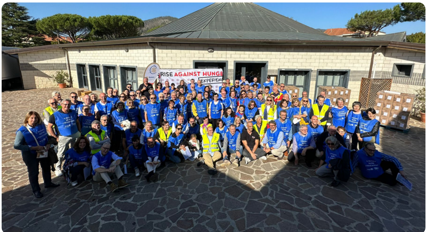
Gli oltre 100 soci rotariani e rotaractiani che hanno partecipato alla preparazione dei pasti